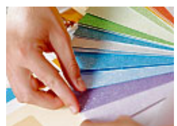
Maler kennen sich mit der Wirkung von Farben aus

Auch wenn der Handel häufig anders für das Auftragen von Dekorativ- oder Sanierungsputzen wirbt: Heimwerker sind schon mit der Vielfalt der Putze und der Arbeitsmethoden völlig überfordert. Die Verarbeitung von Lehm-, Kalk- und Kunstharzputzen ist immer noch eine Kunst für sich. Der Malerfachbetrieb übernimmt diese Aufgaben schnell und kennt viele Putzarten und Putzstrukturen, die dem Heimwerker verborgen bleiben. Bei allen Maler- und Verputzarbeiten arbeitet er deutlich zeiteffizienter, was bei Renovierungsmaßnahmen von großem Vorteil ist.