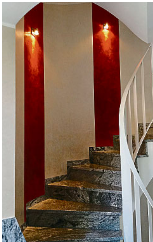
Mut zur Farbe: In diesem Treppenhaus wurde durch die Farbgestaltung und Beleuchtung ein Akzent gesetzt.