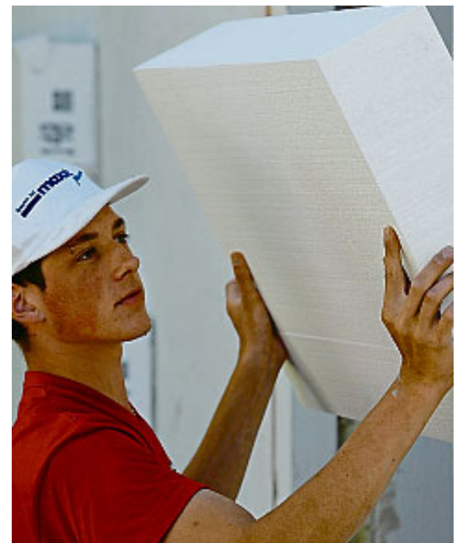
Die Innendämmung kann in den Herbst- und Wintermonaten durchgeführt werden.

unterschiedlichen Dämmsystemen und -materialien aus, sie wissen, ob die geplanten Maßnahmen für eine Förderung durch das KfW-Programm „Energieeffizient sanieren“ in Frage kommen. Denn um in den Genuss der Förderung zu kommen, sind hohe technische Anforderungen bei der Berechnung und Umsetzung der Maßnahmen zu erfüllen. Mit einer Do-it-yourself-Maßnahme ist es hier nicht getan.